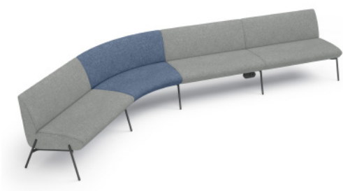
Low Back Sofa with LX2 低背沙发组合带 LX2 插座