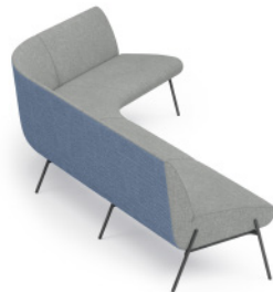
Low Back Sofa 低背沙发组合