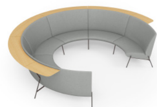
High Back Sofa with Rear Table 高背沙发组合带后背小桌板