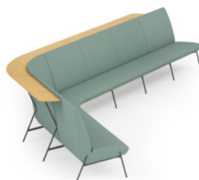
High Back Sofa with Rear Table 高背沙发组合带后背小桌板