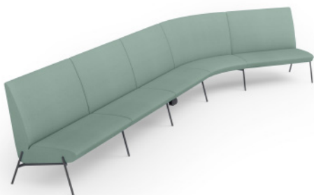
High Back Sofa with LX2 高背沙发组合带 LX2 插座